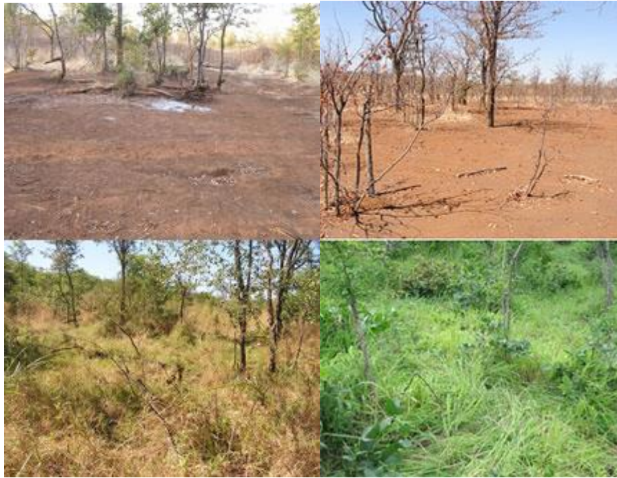
Paysages transformés (en haut : avant ; en bas : après) grâce à l'«aménagement holistique des sols» préconisé par Allan Savory. Cette méthode de gestion permet de retenir l'eau dans le sol grâce au piétinement des animaux.

Allan Savory a mené de nombreuses études pour lutter contre la désertification. Il a commencé sa carrière en tant que biologiste sur des réserves naturelles qui se trouvent aujourd'hui en Zambie. Il cherchait à comprendre pourquoi certaines terres devenaient arides et perdaient leur végétation. D'après les thèses scientifiques dominantes de l'époque, c'est le pâturage des animaux sur ces terres qui provoque la désertification. Il rédigea donc une note au gouvernement où il proposa de tuer 40 mille éléphants qui vivaient sur ces terres. Le gouvernement suivit sa recommandation, mais ce programme eut l'effet contraire à celui souhaité : au lieu de lutter contre la désertification, les terres sont devenues arides à un rythme plus élevé qu'auparavant et ont perdu quasiment toute leur végétation. Allan Savory confesse que ce fut la plus grande erreur de son existence.